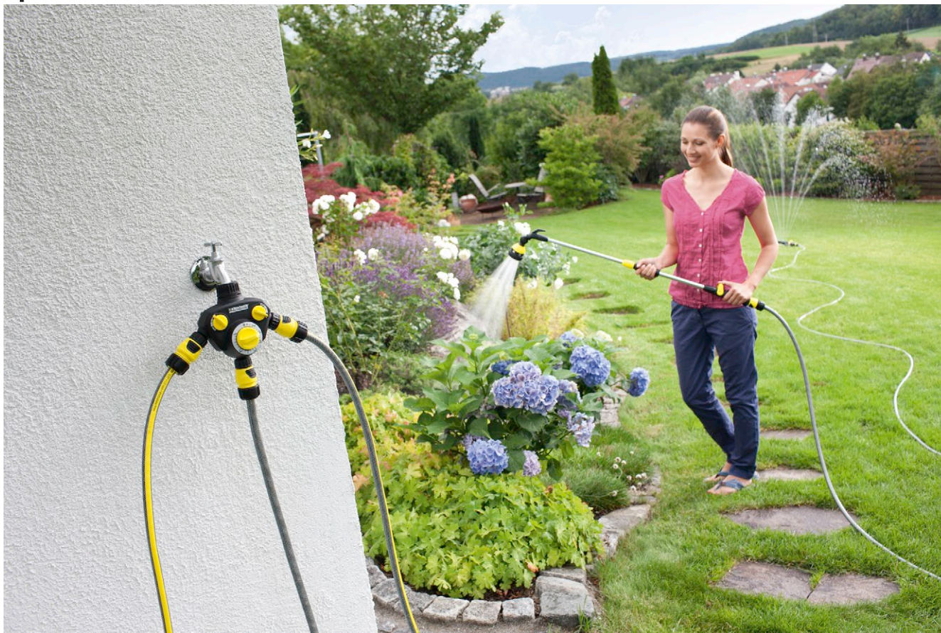
Таймер для полива WT 2 + распределитель 3-х канальный G1, G3/4 для систем полива